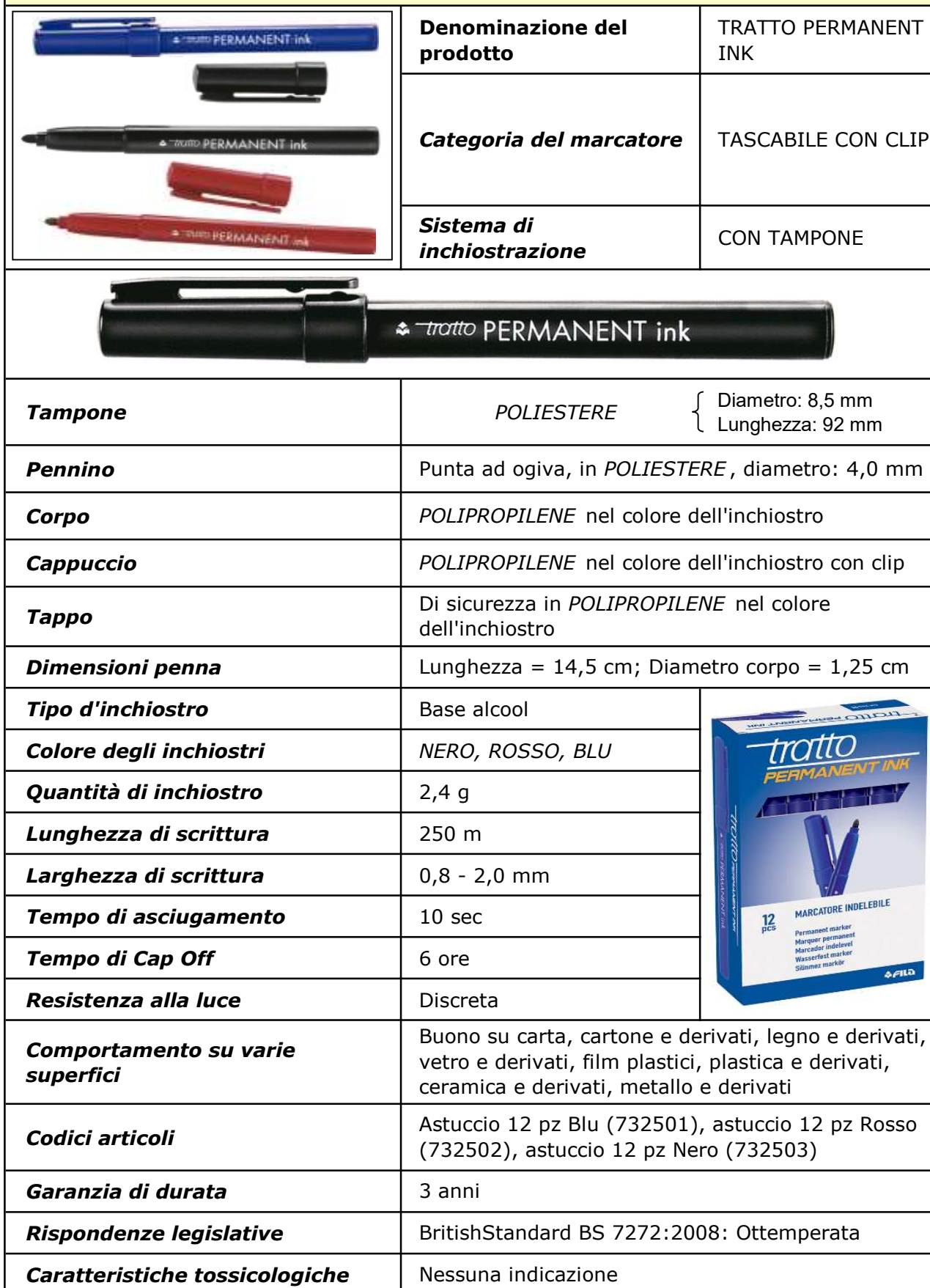
TABELLA CARATTERISTICHE DELLE PENNE FIBRA TRATTO PERMANENT INK