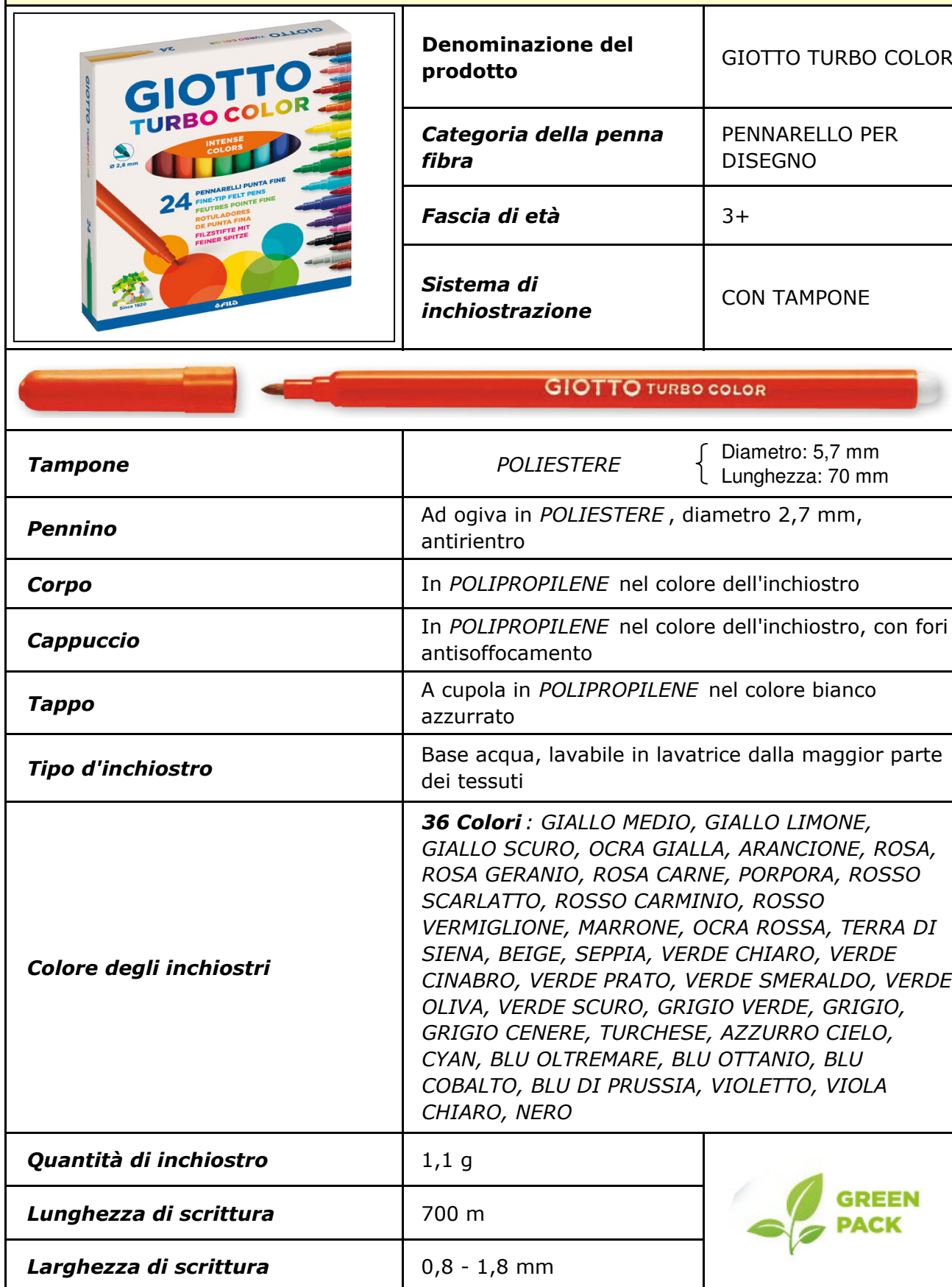
TABELLA CARATTERISTICHE DELLE PENNE FIBRA GIOTTO TURBO COLOR